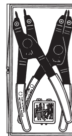
7053K Innen- und Außenring- zange, 4 Spitzen- größen

Nr. 209201 – Je ein Paar Ersatzspitzen für die Zangen Nr. 7300 und Nr. 7301 . Gewicht 0,1 kg.