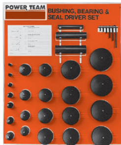
Nr. 27797 Universalsatz (Ohne Werkzeugtafel)