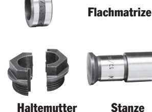
BEISPIEL FÜR WERKZEUGAUSRÜSTUNG VON 20 TONNEN

Lochstanzensatz HP20SP Mit PE102AR-Pumpe, HP20HS-Handfernsteuerung, Schläuchen, Kupplungen, Stempel- und Matrizensätzen in den Durchmessern 6,4, 7,9, 9,5, 11,1 und 13,5 mm. Mit Aufbewahrungskoffer. Gewicht 15,9 kg.