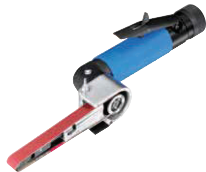
GB 815 H

Leistung und Drehzahl bei 6 bar Betriebsdruck. Druckluft: geölt.