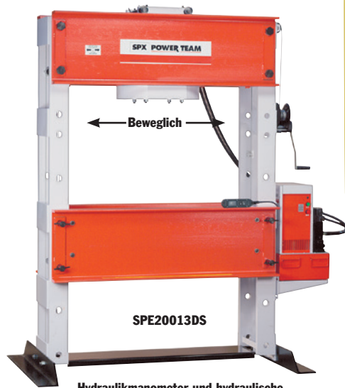
Hydraulikmanometer und hydraulische Anschlussarmaturen im Lieferumfang enthalten.