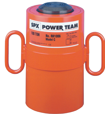
30, 60, 100 Tonnen, doppeltwirkend mit Außengewinde.