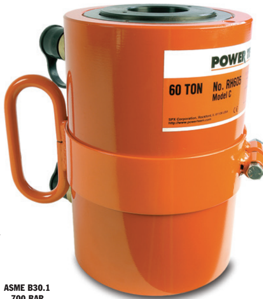
ASME B30.1 700 BAR

• Alle Zylinder mit Kupplungshälften mit 3/8-Zoll-NPT-Anschlußgewinde (Nr. 9796). Die 60- bis 200-Tonnen-Zylinder sind mit abnehmbaren Tragegriffen ausgerüstet.