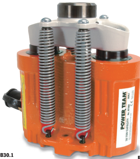
ASME B30.1 700 BAR