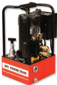
PE30TWP Elektropumpe für Drehmomentschlüssel Siehe Seite 171.