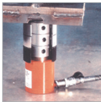
Die Abbildung zeigt den Stützringsatz im Einsatz mit einem 30-Tonnen-Kurzhubzylinder RSS302. Weitere Informationen auf Seite 40.